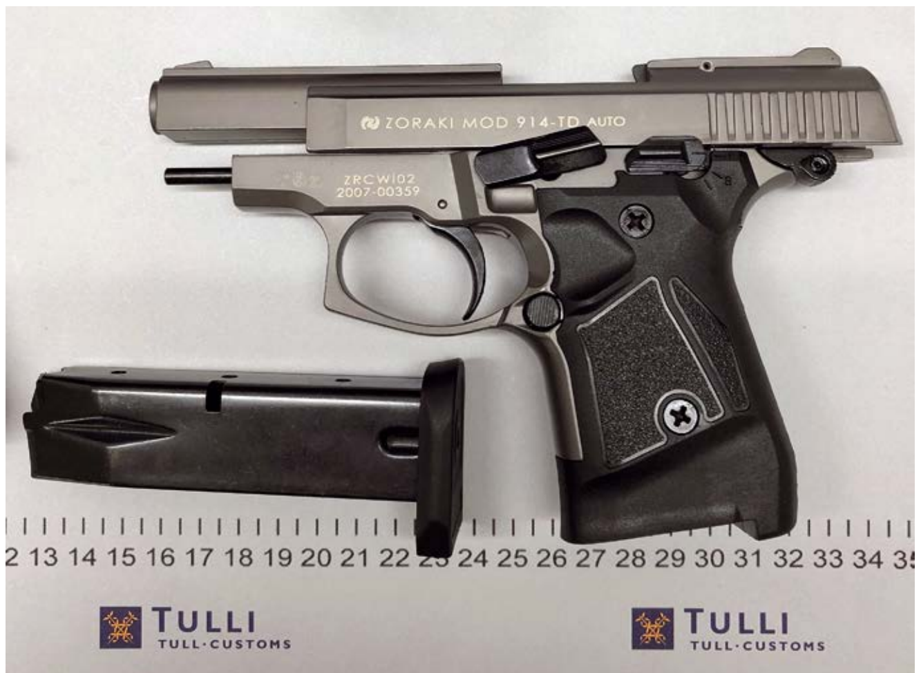
Takavarikoitu starttipistooli, jolla voi ampua kaasupatruunoita.

Tulli takavarikoi elokuun 2020 ja tammikuun 2021 välisenä aikana postilähetyksistä lähemmäs 100 kaasua tai niin kutsuttua starttipistoolia. Lähetykset saapuivat pääasiassa Tšekistä, Puolasta ja Sloveniasta. Ampuma-aseita olivat tilanneet eri puolella Suomea asuvat henkilöt, joilla ei ollut lupaa niiden maahantuontiin. Myös starttipistoolin eli paukkupatruunoiden ampumiseen tarkoitettujen esineiden hallussapito ja maahantuonti vaativat aseluvan, jos sen muuntamista toimivaksi ampuma-aseeksi ei ole tietyin teknisin keinoin estetty. Rikokset ovat tutkittavana alueellisissa tutkintayksiköissä.