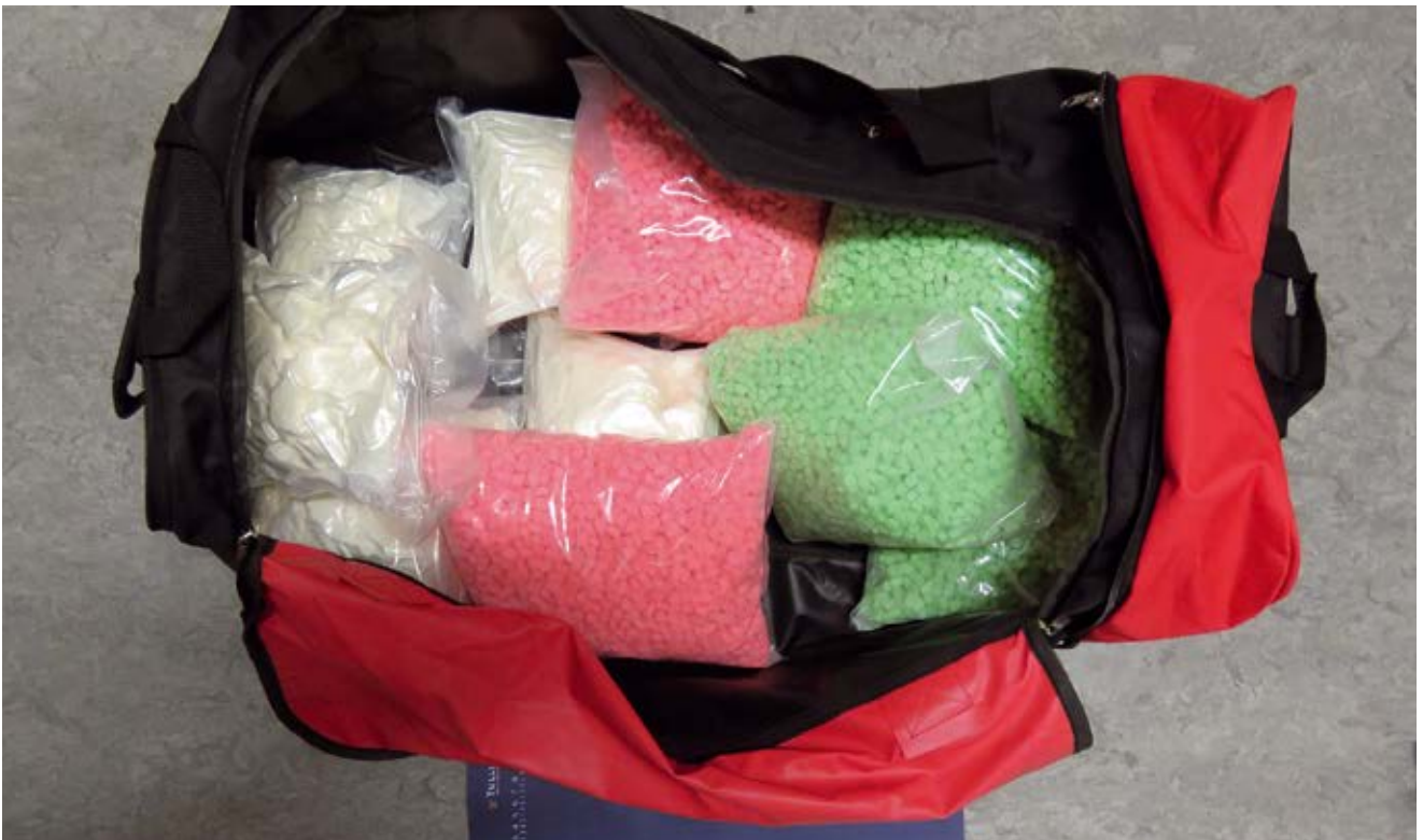
Amfetamiinia ja ekstaasitabletteja.

Rikollisorganisaation jäljille päästiin talvella 2020, kun Suomeen saapuneesta pikarahtilähetyksestä takavarikoitiin noin kuusi kiloa marihuanaa. Varsin pian esitutkinnassa saatiin selville, että Suomessa oli hankittu kerrostaloasuntoja huumausaineiden varastointia ja levitystä varten. Huhtikuussa 2020 Helsingissä takavarikoitiin henkilöautosta sekä asuinhuoneistosta 39 000 ekstaasitablettia, 18 000 Subutex-tablettia ja viisi kiloa amfetamiinia. Elokuussa 2020 takavarikoitiin Vantaalla sijaitsevasta asunnosta 30 000 Subutex-tablettia, 11 kiloa amfetamiinia, 500 grammaa