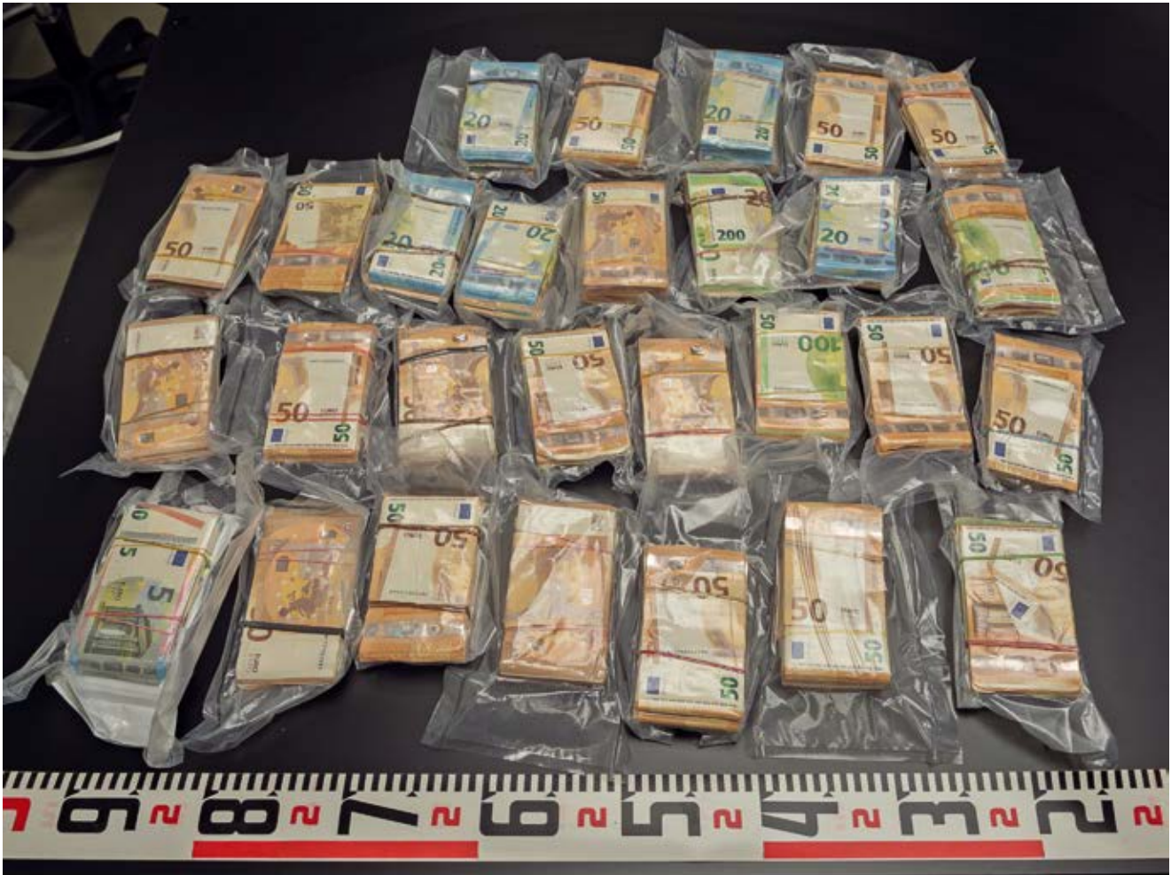
Vantaalla sijaitsevasta asunnosta takavarikoitiin 100 000 euroa käteistä.

kokaiinia sekä 100 000 euroa käteistä. Huumausaineet ja käteinen raha oli kätkeyty asunnon rakenteisiin.