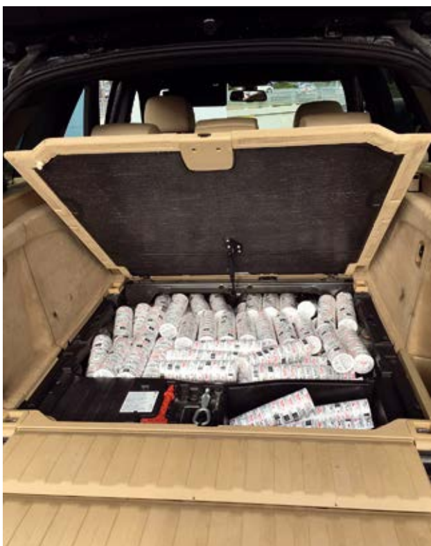
Nuuskakätkö auton vararengaskotelossa.

Tulli jatkoi asian tutkintaa miehen ollessa vapaana. Tutkinnan perusteella oli syytä epäillä, että mies oli aloittanut nuuskan salakuljetuksen