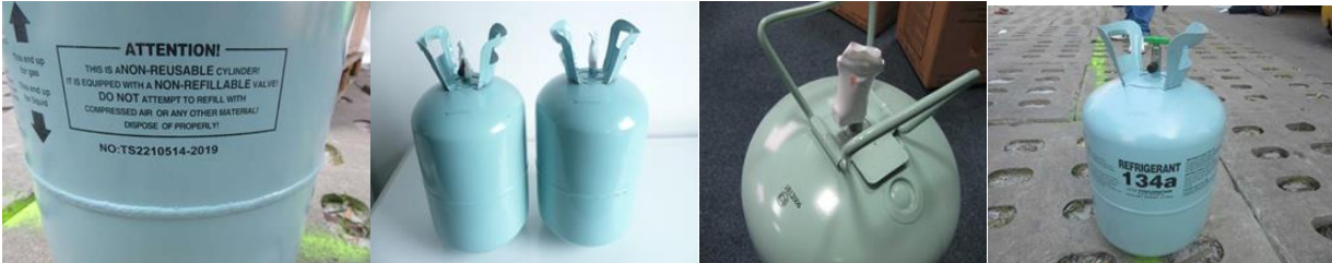
Kuva 2 Kertakäyttöpullon tunnistaa esim. sanoista non-reusable tai non-refillable, pyöreästä pohjasta ja venttiilien huonosta suojasta.

Huom. Fluorattujen kasvihuonekaasujen saattaminen EU-markkinoille kertakäyttöisessä säiliössä (non-refillable container) on kielletty. Kertakäyttöpullon tunnistaa esimerkiksi sanoista non-reusable tai non-refillable, pyöreästä pohjasta ja venttiilien huonosta suojasta. Kuvassa 2 on esimerkkejä kertakäyttöpulloista.