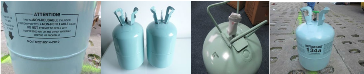
Kuva 2 Kertakäyttöpullon tunnistaa esim. sanoista non-reusable tai non-refillable, pyöreästä pohjasta ja venttiilien huonosta suojasta.

Huom. Fluorattujen kasvihuonekaasujen saattaminen EU-markkinoille kertakäyttöisessä säiliössä (non-refillable container) on kielletty. Kertakäyttöpullon tunnistaa esimerkiksi sanoista non-reusable tai non-refillable, pyöreästä pohjasta ja venttiilien huonosta suojasta. Kuvassa 2 on esimerkkejä kertakäyttöpulloista.